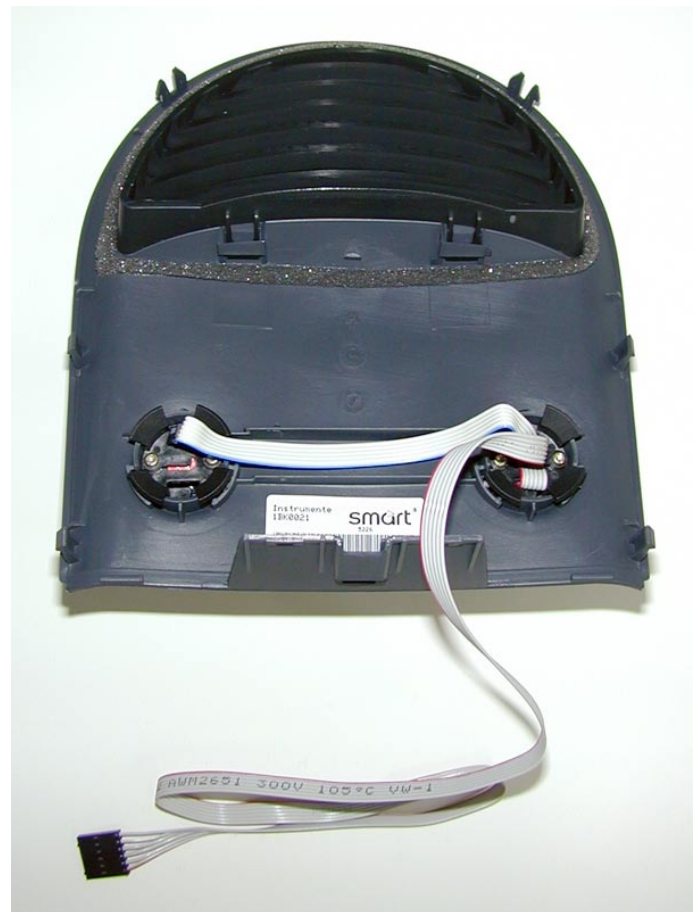
Zusatzinstrument von unten.